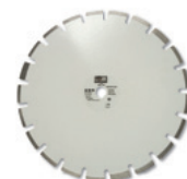
asfalto/cemento fresco – ad acqua – s. laser